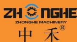
浙江中禾 机械有限公司