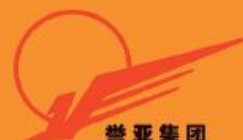
山东誉亚 大豆机械制造有限公司